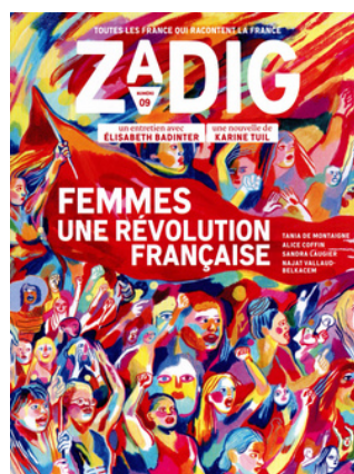
Zadig N°9 Codif 13032 19,00 € Trimestriel Paru le 03/03/2021