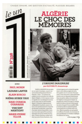
Le 1 N°338 Codif 13114 2,80 € Hebdomadaire Paru le 17/03/2021