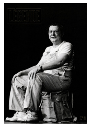
Légende N°3 Codif 13370 20,00 € Trimestriel Paru le 06/01/2021